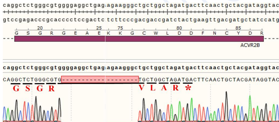
Fig. ACVR2B KO 母细胞 Sanger 验证结果